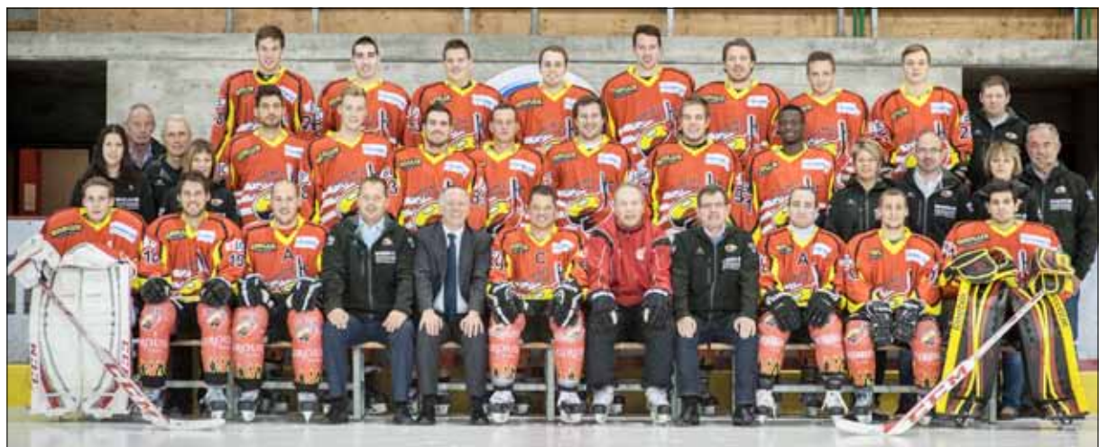
La nouvelle équipe du HCFM I, prête à en découdre sur la glace dès cette fin d'après-midi, coup d'envoi à 18 h 30.

Trois jours avant la parution à 10 h Pour l'édition du mardi: vendredi à 10 h