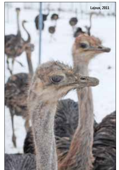
Outre les équidés et les huskies, les autruches seront au centre d'une des activités proposées en octobre par Jura Tourisme.

Davantage de précisions sur ce programme mensuel figurent sur le site internet www.juratourisme.ch . LFM/per