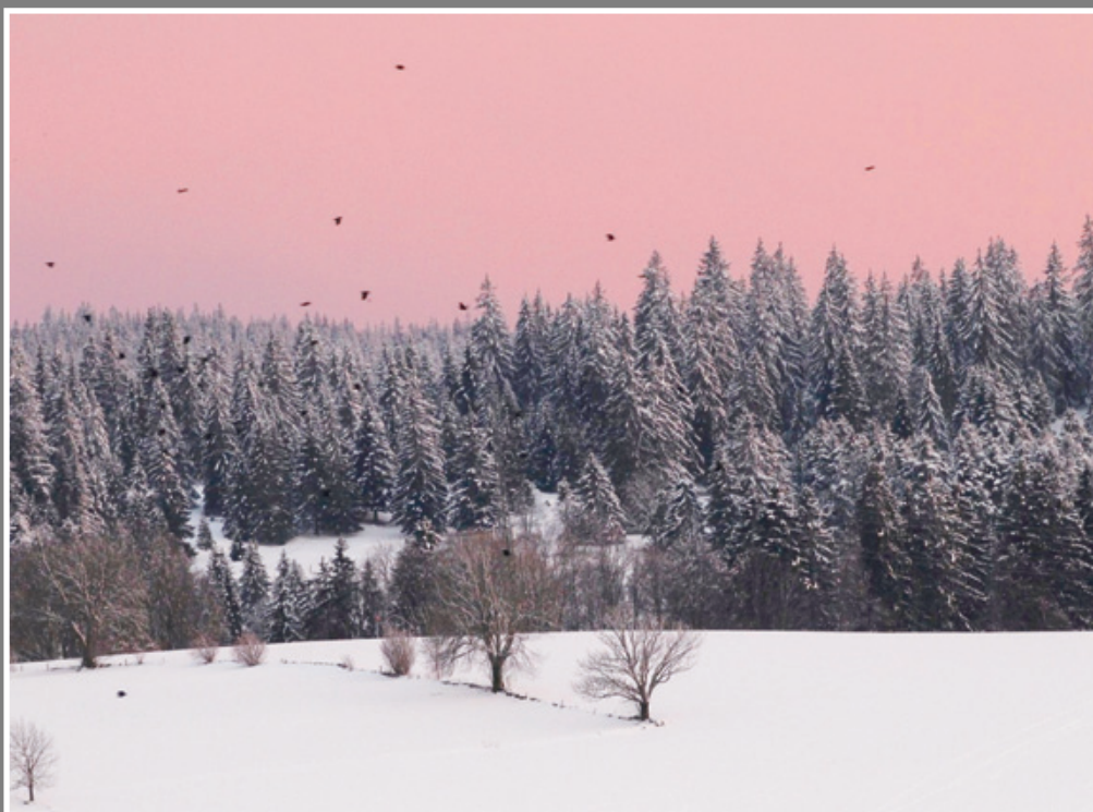
Corneilles dans le coucher de soleil au-dessus du Communal de La Sagne.

Courrier neuchâtelois en version e-paper