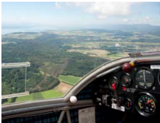
AUDREY PIGUET (IMAGE D'ILLUSTRATION)

Age du pilote, fiabilité de l'appareil, conditions météorologiques... «ArInfo» a voulu en savoir plus sur ces aspects techniques de l'aviation civile suisse. P5